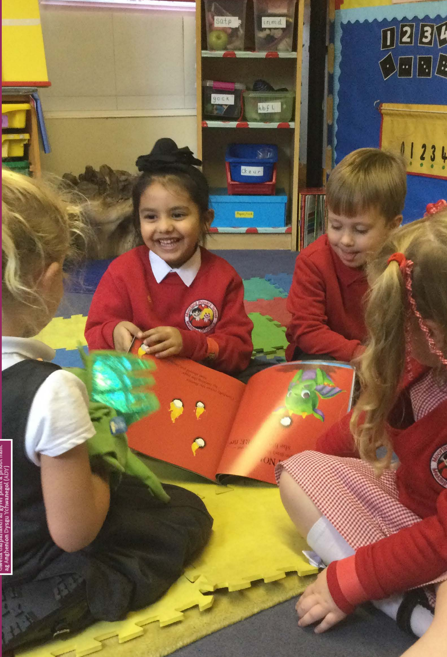
Ysgolion yr 21ain Ganrif Gwella darpariaeth ar gyfer plant a phobl ifanc ag Anghenion Dysgu Ychwanegol (ADY)