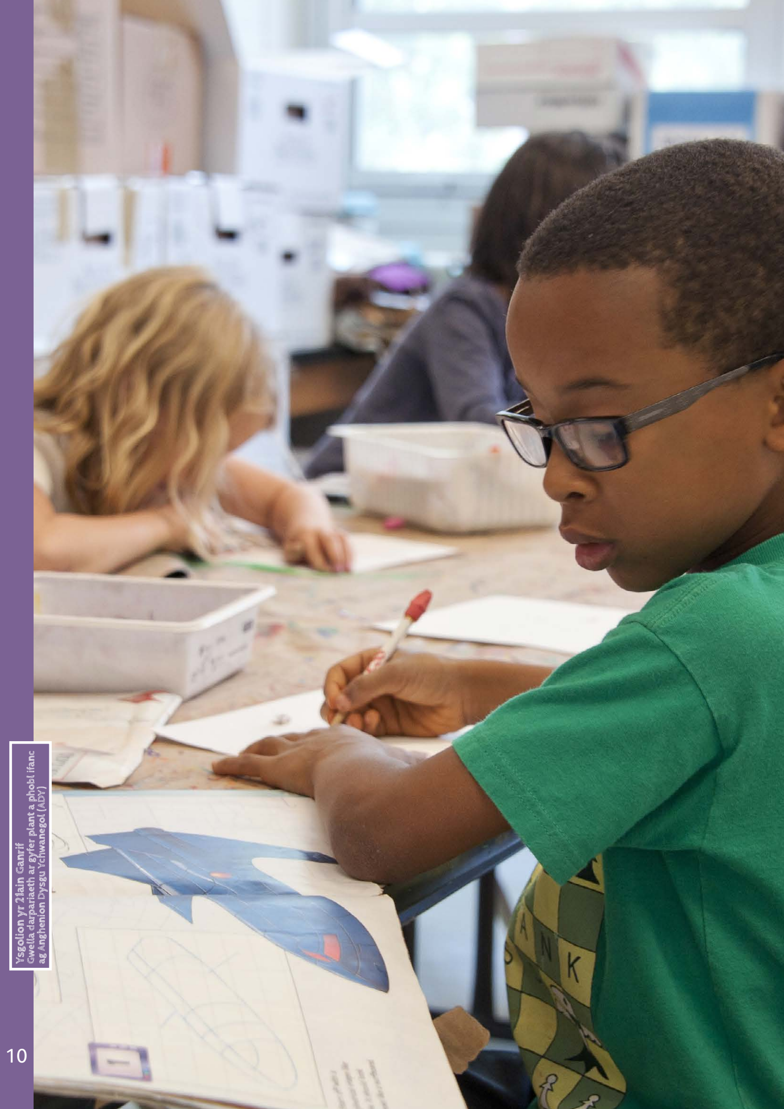
Ysgolion yr 21ain Ganrif Gwella darpariaeth ar gyfer plant a phobl ifanc ag Anghenion Dysgu Ychwanegol (ADY)