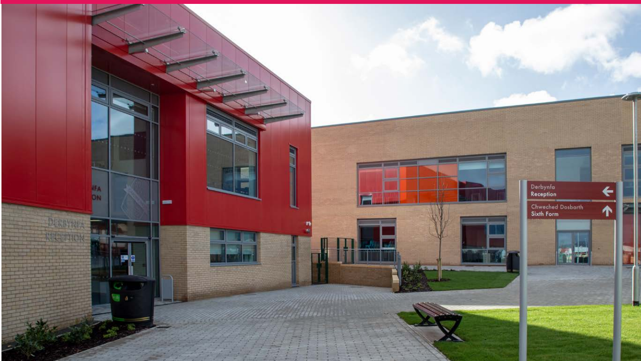
Cardiff West Community High

Wedi'r penderfynu, bydd Cyngor Caerdydd yn hysbysu pawb y mae'r cynnig yn effeithio arnynt nhw o'r penderfyniad. Caiff ei gyhoeddi hefyd ar wefan y Cyngor.