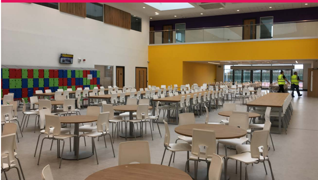
Eastern High School

Byddai angen pennu goblygiadau Adnoddau Dynol pellach y cynnig wrth i'r prosiect ddatblygu, yn enwedig o ran gweithredu'r cynllun MBC a amlinellir uchod. Mae angen canllawiau pellach gan Lywodraeth Cymru i ddeall y trefniadau gweithio llawn o ran rheoli cyfleusterau er mwyn asesu'r effaith, os o gwbl, ar staff presennol ysgolion. Byddai angen i'r Corff Llywodraethu a thîm arwain yr ysgol hefyd ystyried a oes angen unrhyw newidiadau staffio i gefnogi'r defnydd o safle'r ysgol gan y gymuned ehangach. Bydd Gwasanaethau Pobl Adnoddau Dynol yn darparu cyngor a chymorth yn ôl yr angen.